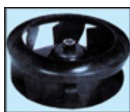
Трехмерный вентилятор, уменьшающий уровень шума внутреннего блока